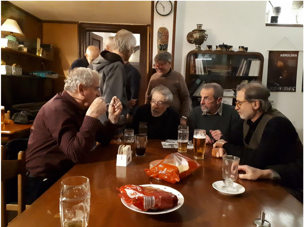
Takhle jsme se bavili