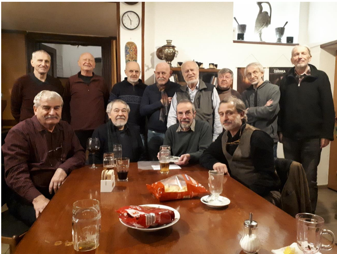
Bez Pacíka je fotka ostřejší a hezčí.